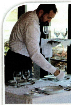
20.11. ábra. Rendezvényre való felkészülés, terítés

Maga az étkezési kultúra nem csak az étkezésről szól, annál jóval több: az italfogyasztás, a terítés, a felszolgálat is részét képezi (20.11. ábra). Ezekről az ágazati alapoktatás során már sok mindent tanultunk. Most nem a pincér-vendégtéri szakember oldalról, hanem a rendezvény vendégének szemszögéből ismételjük kicsit át a tanultakat.