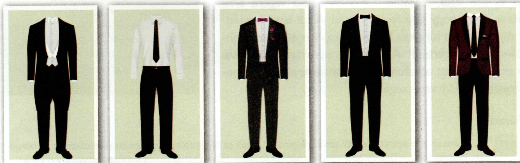
20.13. ábra. Viseleti minták a dress code-ra

Ha a meghívón nincs jelezve dress code, akkor a 18 óráig kezdődő rendezvényre, fogadásra hivatali öltözetben menjünk, későbbi időpontban pedig formal szerint.